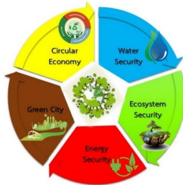
ภาพที่ 2 WEEGCE MODEL